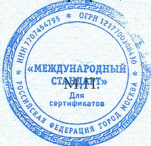
Схема сертификации: Зс.